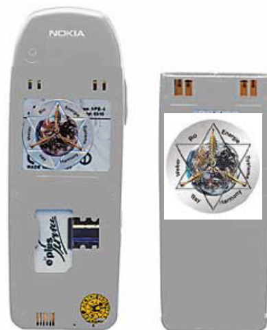
L'autocollant protecteur collé sur la face intérieure de la batterie du téléphone portable