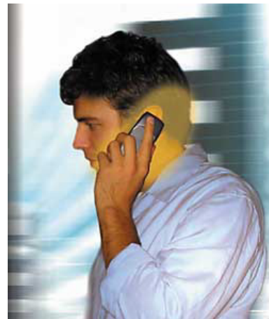
Rayonnement des ondes nocives