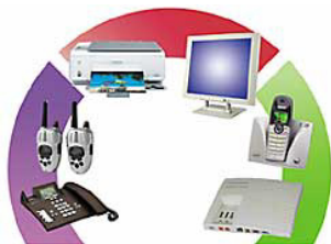
Autres domaines d'application

Pour fonctionner, la puce Ray-Harmony doit impérativement être décollée de sa protection en plastique et collée sur la face interne de la batterie.