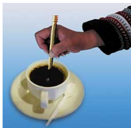
Remuez quelques secondes sans frotter le récipient pour dynamiser votre boisson