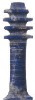
Piliers Djed égyptiens