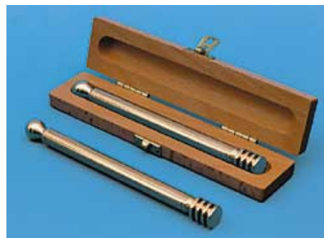
L'énergétiseur Isis est livré dans son coffret en bois

Il est livré dans son étui en bois permettant de le transporter et de le stocker proprement. L'énergétiseur Isis est un instrument utile chaque jour et qui peut facilement être emporté à son lieu de travail et en vacances.