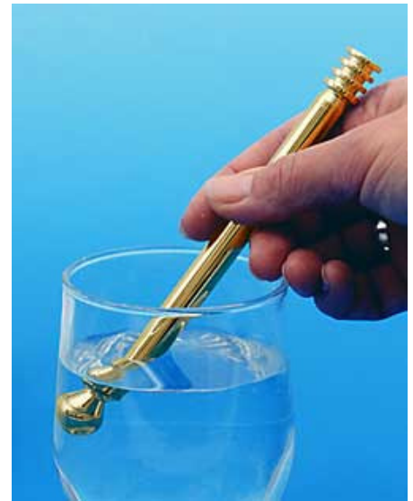
L'énergétiseur Isis pour boissons

La puissance particulière de l'énergétiseur Isis, chargé des mêmes informations que tous les activateurs d'eau de la gamme Weber-Bio, permet de penser qu'il peut également offrir les mêmes avantages et convertir les rayonnements négatifs, mais bien sûr dans des proportions inhérentes à sa taille. La forme sphérique de son extrémité permet de répartir de manière égale son rayonnement dans toutes les directions.